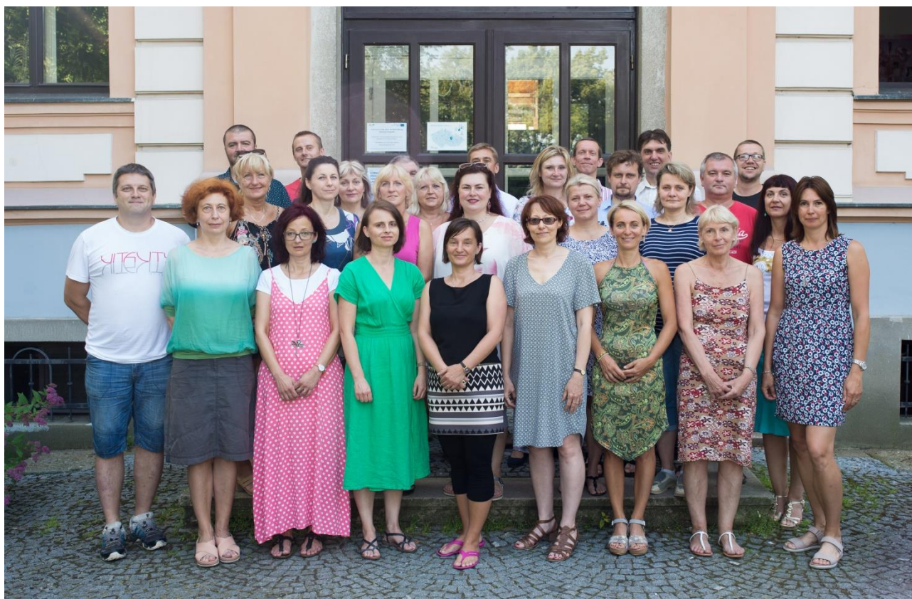
Pedagogický sbor gymnázia ve školním roce 2018/2019