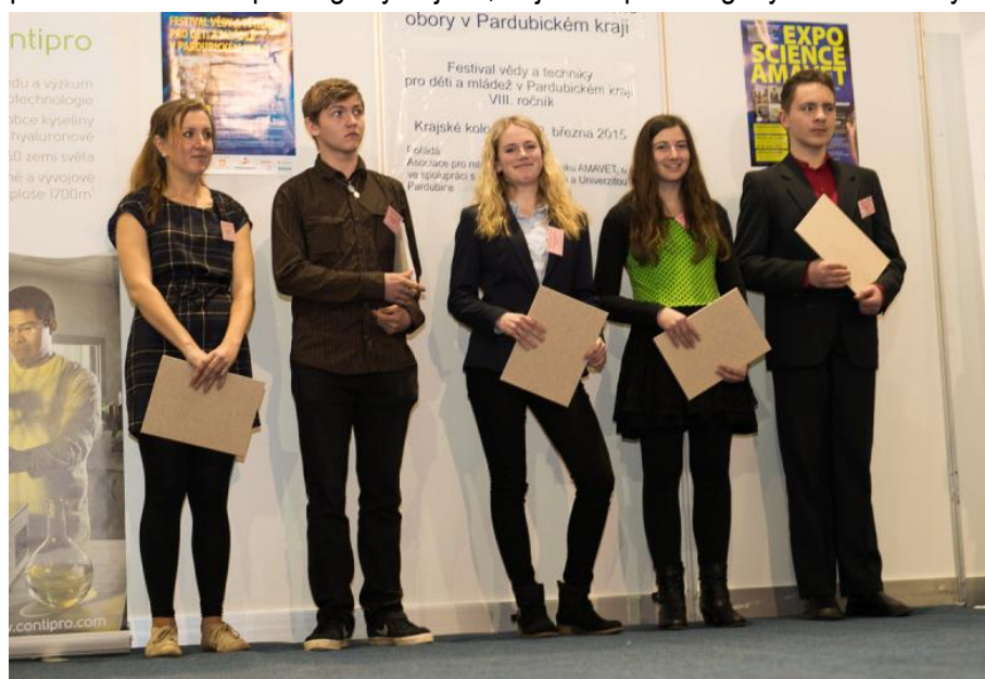
Festival vědy a techniky pro děti a mládež v Pardubickém kraji

Významnou součástí mimoškolních aktivit je i účast našich žáků ve vzdělávacích a sportovních soutěžích, v nichž dosáhli velmi dobrého umístění.